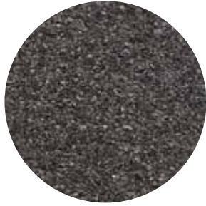
Fine mineral black